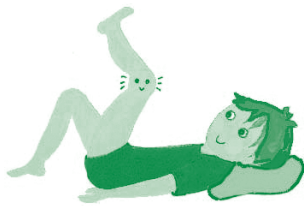
Figura 6. Los ejercicios son necesarios para mantener y mejorar la función articular y la fuerza muscular.

Los Ejercicios: Éstos son necesarios para mantener y mejorar la función articular y la fuerza muscular (figura 6). Hay varias clases de ejercicios: los activos, que son los ejercicios físicos que realiza el propio niño; los pasivos, que otra persona ayuda a realizarlos y los isométricos que consisten en contraer un determinado músculo durante unos segundos, sin mover la articulación inflamada.