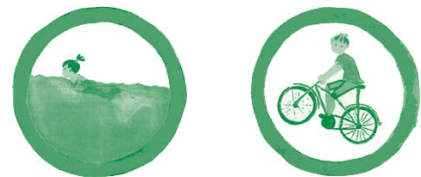
Figura 7. DEPORTES: la natación es uno de los mejores ejercicios. El triciclo y la bicicleta son muy útiles para mantener la movilidad articular sin forzar las articulaciones inflamadas.

No hay un fármaco capaz de curar definitivamente a todos los pacientes, pero podemos utilizar medicamentos, solos o combinados, para disminuir la inflamación y ayudar a controlar la enfermedad, siempre considerando si es mayor el beneficio que el riesgo. Como ocurre con todos los tratamientos, pueden producirse efectos secundarios.