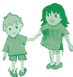
Figura 4. Cuando sólo se inflama una articulación, se llama 'monoartritis', y habitualmente es la rodilla.

Las articulaciones que más se afectan son las de las piernas: caderas, rodillas, tobillos y dedos de los pies. Es muy característica la inflamación de las zonas de unión del hueso con los tendones y ligamentos (entesitis). Lo más típico es en los calcáneos, lo que produce dolor en los talones (o talalgia) al iniciar la deambulación. Más adelante puede aparecer dolor en las nalgas, incluso de madrugada despertando al niño, lo que significa afectación de las sacroilíacas, que son las articulaciones que unen la columna con la cadera. Esta lesión se puede detectar con las radiografías.