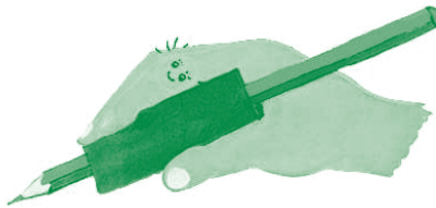
Figura 8. Algunos niños con algún tipo de incapacidad necesitarán adaptar o utilizar utensilios especiales para algunas actividades de la vida diaria.

También puede ser necesario que el cirujano plástico corrija el defecto de crecimiento de la mandíbula (micrognatia), y que el dentista indique ortodoncia.