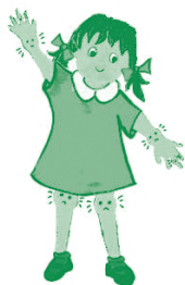
Figura 3. Artritis Reumatoide Juvenil tipo del adulto:

Los niños con muchas articulaciones hinchadas adoptan malas posiciones o posturas fijas más cómodas para protegerse del dolor y de la rigidez, es decir que doblan las articulaciones dolorosas. Las rodillas pueden quedarse rígidas en flexión, los tobillos pueden quedarse hacia abajo, las muñecas se quedan caídas y el cuello tiende a quedarse hacia delante y torcido. Esto hay que vigilarlo y evitarlo con el tratamiento adecuado.