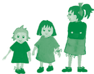
Figura 2. Los síntomas principales son: dolor, hinchazón y aumento de calor en las articulaciones, con rigidez y dificultad para realizar los movimientos.